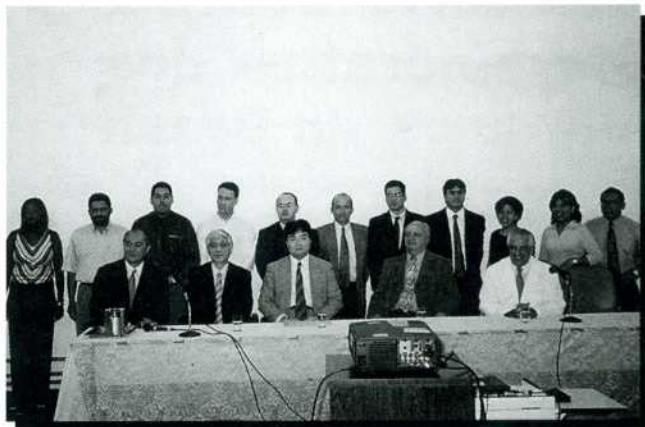
Alunos (em pé) e representantes da JICA, Consulado e Unicamp (sentados)

Participaram do treinamento dois médicos brasileiros e 12 estrangeiros da área de abrangência dos TCTP's brasileiros – América Latina e África lusófona: Bolívia, Colômbia, Costa Rica, El Salvador, Equador, Guiné-Bissau, Moçambique e Peru.