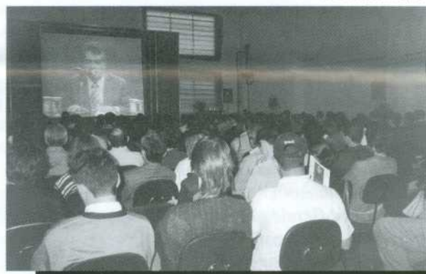
Audi-tório anexo com tela