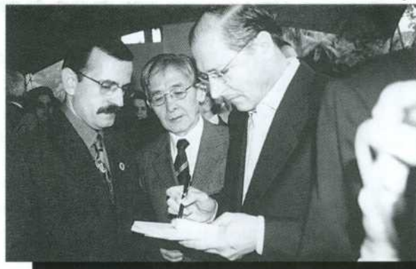
Governador Alckmin prestigiou o lançamento