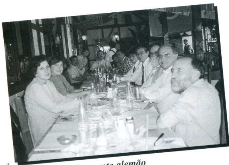
Almoço no restaurante alemão

Realizado em Florianópolis – SC, de 22 a 24 de outubro, com objetivo de debater temas de interesse técnico-científico, os projetos de cooperação técnica entre Brasil e Japão e propostas de implementação de atividades de fortalecimento e promoção de projetos da JICA no Brasil.