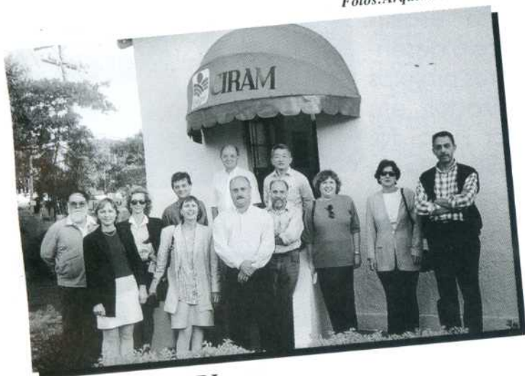
Visita ao EPAGRI