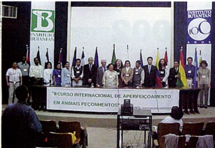
Cerimônia de abertura do Curso "Animais Peçonhentos"