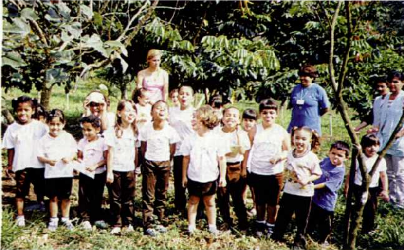
Alunos do Centro de Convivência Infantil do Instituto Florestal visitam o Arboreto