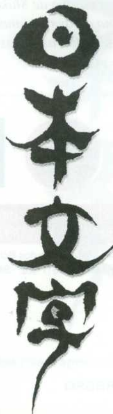
Os quatro ideogramas que significam "A escrita do Japão"

Para aumentar o grau de dificuldade, ainda usam o romaji , para grafar palavras japonesas em letras romanas. Foi introduzido por missionários estrangeiros a partir do século 16. Ainda confunde muito os japoneses, porque difere da maneira tradicional. Atualmente o que mais preocupa os linguistas é a área dos computadores. Desde a sua popularização, os micros usam softwares que traduzem do japonês para o inglês. Como os 50 mil kanji não puderam ser arquivados, foram sumariamente simplificados, dando margem a críticas. Alegam que se corre o risco de esquecer muito do que sabem. Dizem que os intelectuais de hoje conseguem ler kanji , mas não sabem escrevê-los. O que é certo é que a escrita originada há cerca de 1900 anos conseguirá sobreviver às mudanças do milênio.