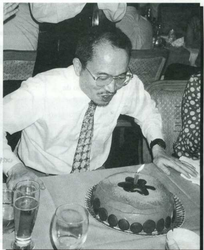
Okabe também apaga as velinhas