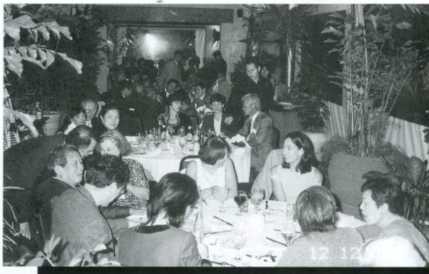
Detalhe da festa

Nosso jantar de confraternização de final de ano aconteceu no dia 11 dezembro de 2002, nos salões do hotel Blue Tree Towers, na avenida Faria Lima, esquina com av. Juscelino, que é um hotel novo da rede, local bastante apropriado para este tipo de evento. Contamos novamente com as presenças ilustres do cônsul geral do Japão em São Paulo, Kiyotaka Akasaka; do diretor geral da JICA São Paulo, Hyogen Komatsu; do diretor administrativo e de cooperação técnica da JICA São Paulo, Ryusuke Ishibashi e a presença importante de inúmeros bolsistas e familiares. Em seus discursos, as autoridades, além dos agradecimentos, ressaltaram a participação da ABJICA nos programas de cooperação técnica entre o Brasil e o Japão. No aspecto gastronômico, tivemos só elogios. O karaokê estava muito procurado e outro grande sucesso foi o brinde, distribuído a todos os presentes - um cristal com imagem holográfica. Como sempre este é um evento que nenhum bolsista pode perder, e já estamos preparando o próximo, com muitas novidades. Aguarde.