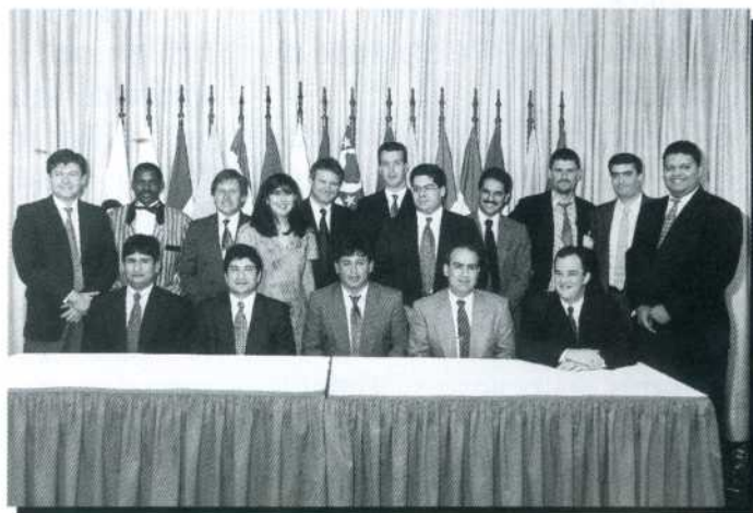
Os alunos no encerramento do curso