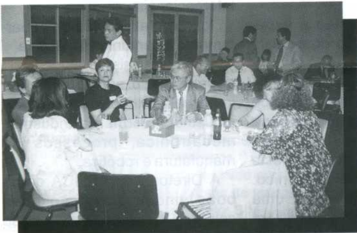
Detalhe da Festa