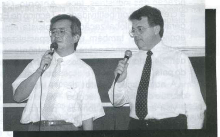
A dupla "Dito e Feito" - sucesso no Karaokê