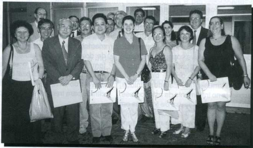
O registro da visita

O Centro possui ainda os Núcleos de Informação Tecnológica, de Assistência Tecnológica e de Pesquisa Aplicada. Atuando como pólo de criação de novas tecnologias, desenvolvendo e aperfeiçoando as já existentes e difundindo-as entre entidades que utilizam processos de automação industrial, contribui para a capacitação de recursos humanos e sua otimização tecnológica. A ABJICA agradece ao Senai pela oportunidade de conhecer este exemplo muito bem sucedido de transferência de tecnologia, através de projeto de cooperação técnica da JICA.