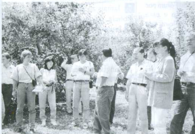
Visita à plantação