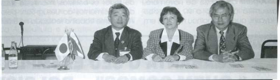
Delegação da ABJICA/SP