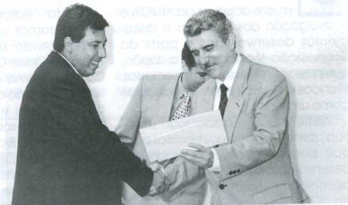
Cerimônia de Encerramento